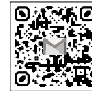
So erreichen Sie uns im web und per e-Mail

Schützen pflegen das immaterielle Kulturerbe