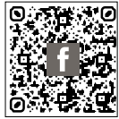
... zu unserer Vereinsseite