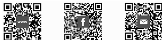
Im Web, auf Facebook und per e-Mail

Web: http://www.weilemer-schuetzen.de Facebook: http://www.facebook.com/WeilemerSchuetzen e-Mail: info@weilemer-schuetzen.de