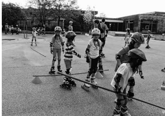
Einer der Programmpunkte: Inline-Parcours-Wettbewerb für Kids!

Viele Grüße von eurer Ski- und Snowboardschule Schönbuch