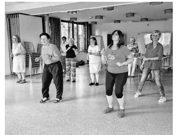
Sportliche FSH Krebs Gruppen Böblingen und Tübingen nach dem Patiententag in der Universitäts-Frauenklinik Tübingen am Samstag, 24. Juni 2023